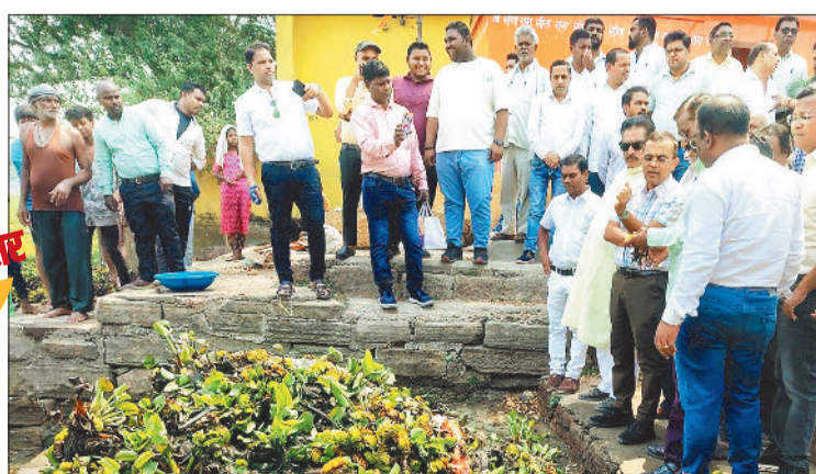
कलेक्टर की मौजूदगी में शुरू हुआ सफाई अभियान।

कभी नगर की शान रहे ऐतिहासिक रामबांधा तालाब की स्थिति समय के साथ बदहाल होती जा रही थी। हरिभूमि द्वारा लगातार तालाब की बहाली को लेकर खबर प्रकाशित करते हुए प्रशासन का ध्यान आकृष्ट कराया गया। सोमवार 14 अप्रैल के अंक में