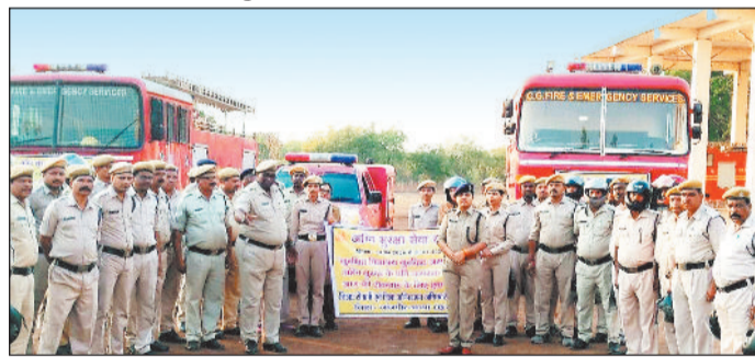
अग्नि शमन कार्यालय से रैली निकालते नगर सेना के जवान।