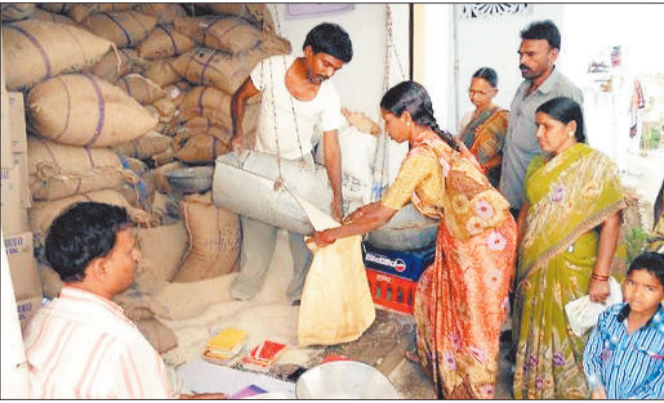
चावल पाने पीडीएस दुकान पहुंचे कार्डधारी।

सरकारी एवं समूह की राशन दुकानों में चावल सहित अन्य सामग्री लेने के लिए कार्ड धारी की भारी भीड़ देखी जा रही है खास बात यह है कि अप्रैल में एक साथ तीन महीने का राशन दिया जा रहा है। गौरतलब है कि शहर सहित ग्रामीण क्षेत्रों में इस समय राशन कार्ड धारी लोग पीडीएस का चावल लेने के लिए कड़ी मशक्कत कर रहे हैं। खास बात यह है कि अप्रैल महीने में 3 महीने का राशन एक साथ दिया जा रहा है। जिसके कारण कार्ड धारी की लंबी लाइन सुबह से शाम तक देखी जा रही है। एक तरफ अप्रैल के महीने में तेज गर्मी ने शुरुआत कर दी है जहां सुबह 10 बजे के बाद शाम 5 बजे तक लोगों का घरो से निकलना मुश्किल हो जा रहा है वहीं लोग अभी राशन लेने के लिए सुबह से शाम तक लाइन में लगे नजर आ रहे हैं। जिला मुख्यालय जांजगीर के बाजार पर तिवारी बाल उद्यान जांजगीर नैला रोड में राशन सामग्री दिया जा रहा है। इसी प्रकार चांपा अकलतरा बलीदा नवागढ़ पामागढ़ शिवरीनारायण खरौद समेत ग्रामीण क्षेत्रों में भी राशन लेने के लिए लोग मशक्कत कर रहे हैं प्रदेश के साथ-साथ जांजगीर-चांपा जिले में भी 3 महीने का चावल