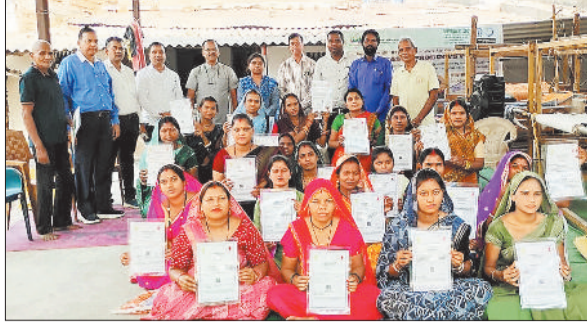
प्रमाण पत्र के साथ महिलाएं।