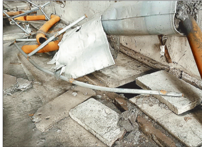
हादसे के बाद मौके पर क्षत-विक्षत अवस्था में पड़ा बायलर पाइप का हिस्सा।