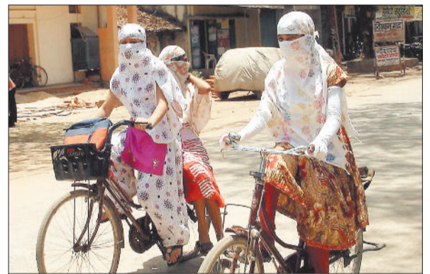
गर्मी से बचने स्काफ बांधकर जाती युवतियां।